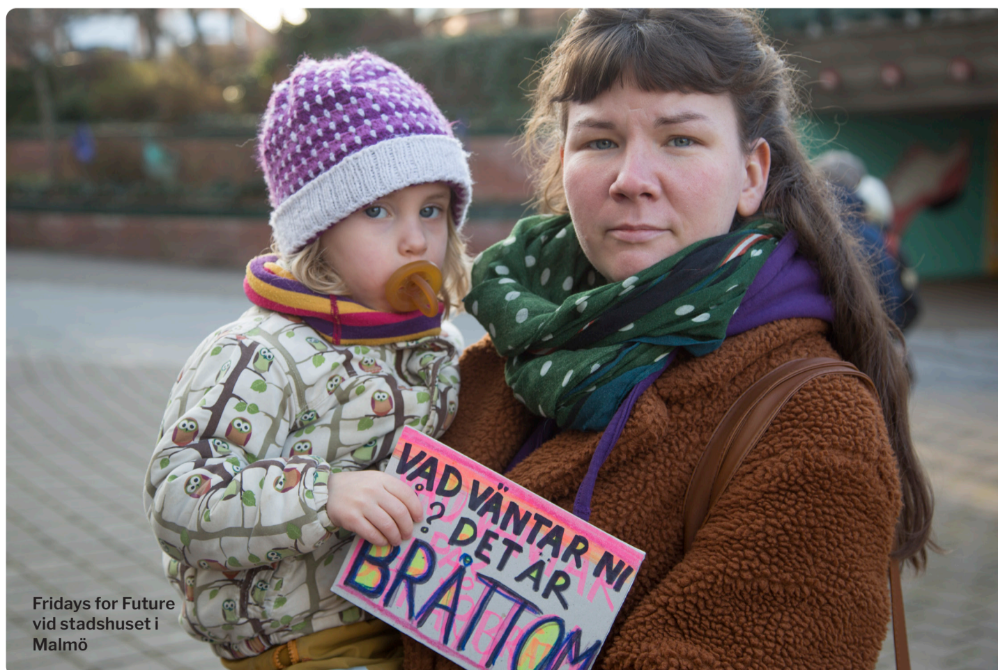
Fridays for Future vid stadshuset i Malmö