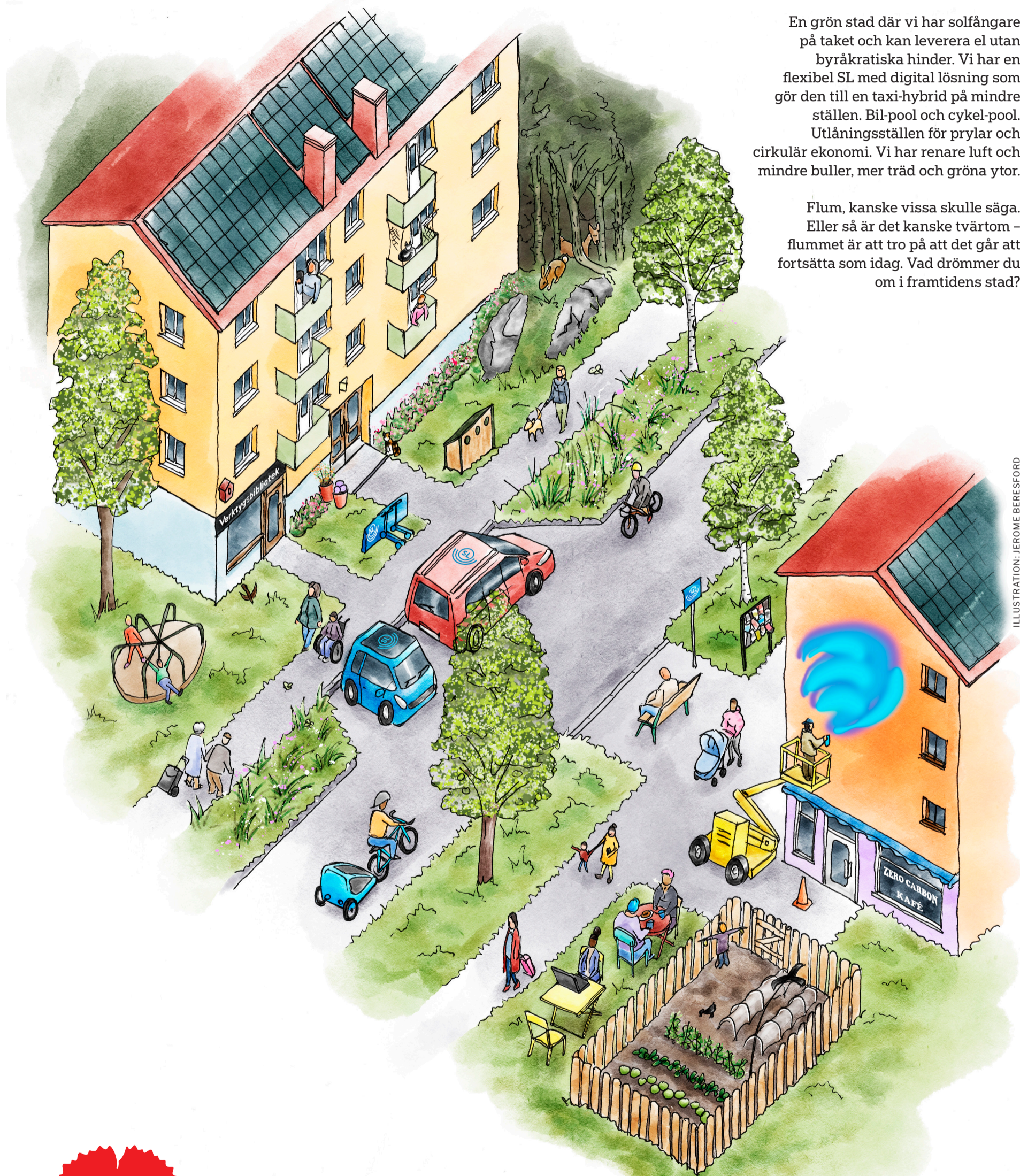
ILLUSTRATION: JEROME BERESFORD

Flum, kanske vissa skulle säga. Eller så är det kanske tvärtom – flummet är att tro på att det går att fortsätta som idag. Vad drömmer du om i framtidens stad?