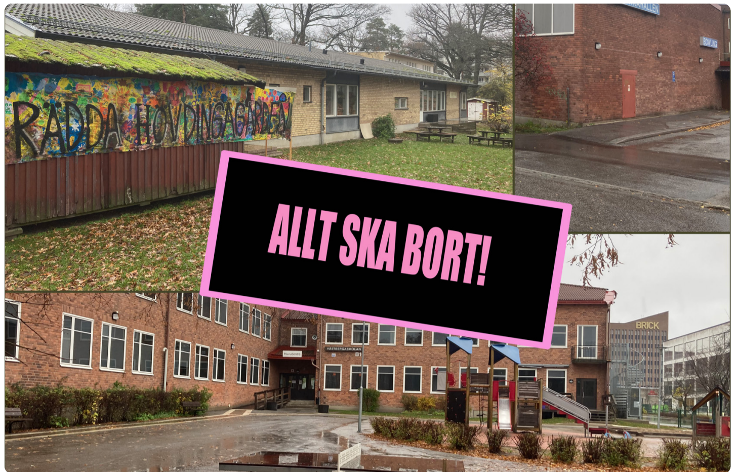
Vänsterpartiet i Älvsjö-Furuängen vill behålla Västbergaskolan, Brännkyrkahallen och Hövdingagården.